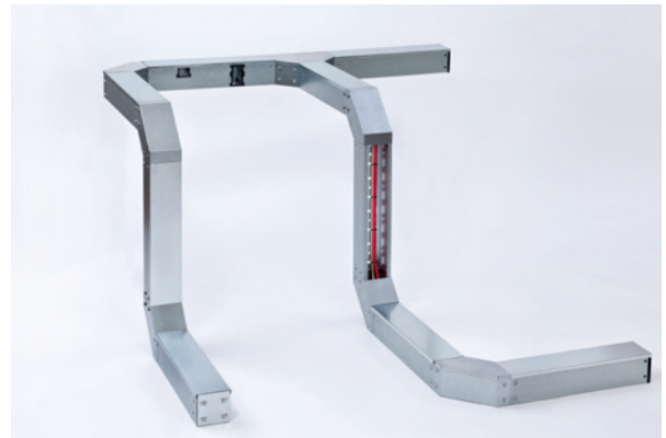
VARIOX®-Baugruppe – aus wenigen Systemteilen lassen sich individuelle Streckenverläufe realisieren.

Für das VARIOX®-Kanalsystem steht wie gewohnt das gesamte PFLITSCH-Dienstleistungsprogramm sowie Maschinen und Werkzeuge zur schnellen Bearbeitung zur Verfügung. Das bietet die Sicherheit, für unterschiedlichste Anforderungen und zur flexiblen Gestaltung aller Kanal-Verläufe gut gerüstet zu sein.